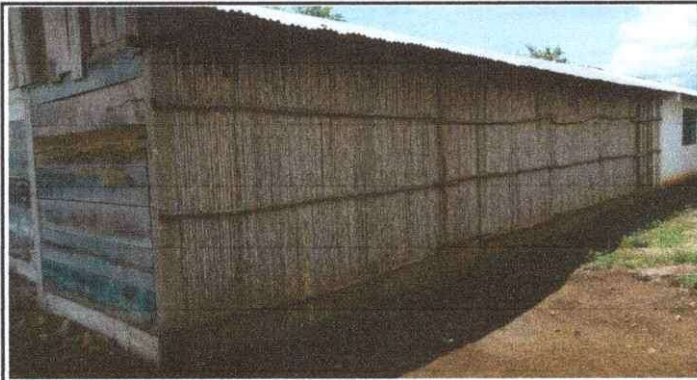
Foto1: Se observa el modulo de una aula expuesta a la humedad